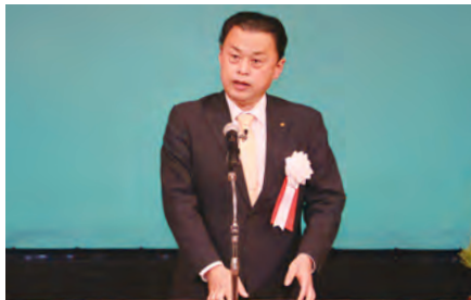
【会長(県知事)あいさつ】