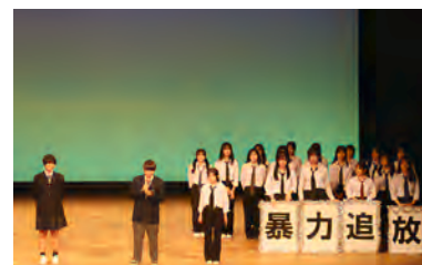
参加した感想を発表する高校生の代表