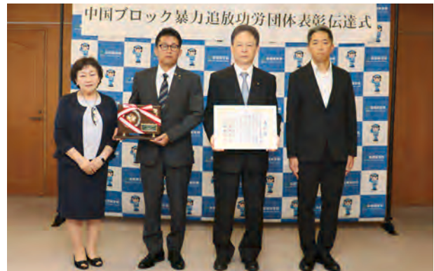
左から山口理事長、羽手原社長、白神会長、中井警察本部長