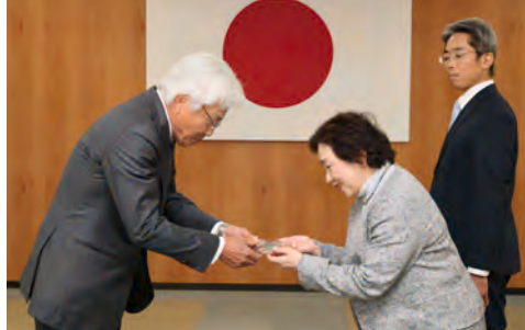
山口理事長から記念品を贈呈