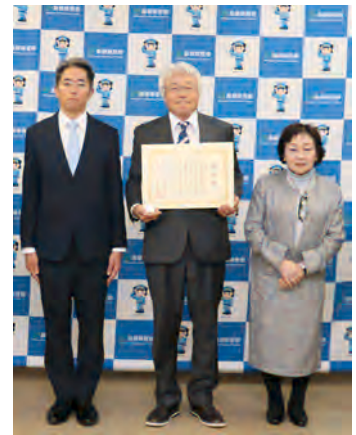
左から中井警察本部長、洪会長、山口理事長