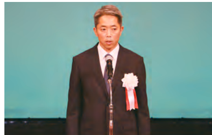
【副会長(警察本部長)あいさつ】