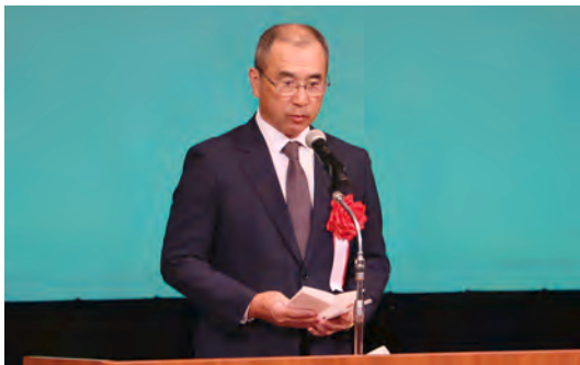
【来賓(県議会議長)祝辞】

続いて、来賓を代表して園山 繁島根県議会議長から祝辞をいただき、その後、参加者全員が大会宣言として『『暴力追放三ない運動+1(プラスワン)』と銃器犯罪の根絶・違法銃器排除のための活動を実践し、安全で安心な住みよい島根の実現を目指して邁進すること』を誓いました。