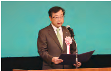
【島根県信用保証協会会長】