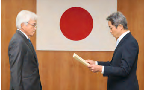
中井警察本部長から感謝状を贈呈