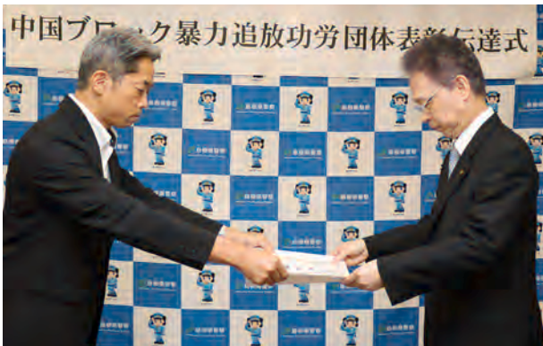
中井警察本部長から白神会長に表彰状が授与