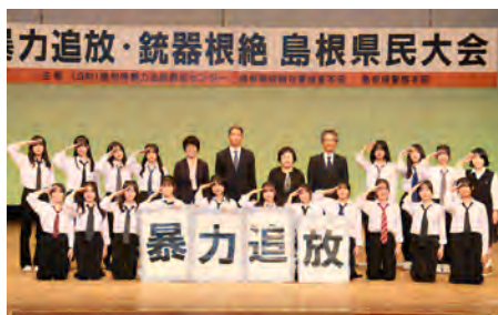
【三刀屋高校ダンス部の皆さん】

三刀屋高校ダンス部によるダンスパフォーマンスが披露され、元気溢れるダンスに会場も大いに盛り上がりました。参加した高校生の代表からは、「反社の危険性がよく分かった」などの感想が聞かれました。三刀屋高校の地元雲南市長も来場され、ダンス部にエールを送られました。