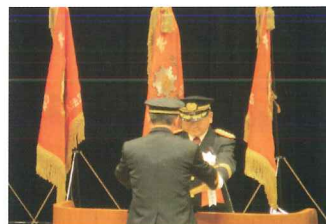
第65回 日本消防協会定例表彰式

第六十五回日本消防協会定例表彰式が二月二十六日(火)日本消防会館ニッショールにおいて挙行されました。本県受章者及び団体は次のとおりです。